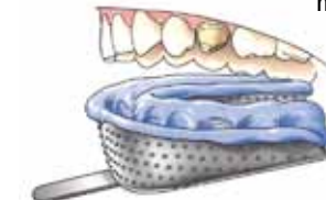
Afdrukkelpel met afdruk materiaal

Vervolgens maakt de tandarts een afdruk van uw hele kaak of het gedeelte waarin zich de afgeslepen kies bevindt. Hiervoor brengt de tandarts een afdrukkelpel met een rubberachtige massa in uw mond. Zo ontstaat een afdruk waarin later in een tandtechnisch laboratorium gips wordt gegoten. Op dit gipsmodel wordt de kroon of brug gemaakt.