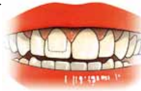
Een kroon over een voortand