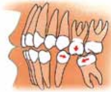
Zijaanzicht van een kaak: uitgroeien en scheef gaan staan van kiezen

Als tanden en kiezen ontbreken, kunnen de tanden of kiezen van de andere kaak in de richting van de open ruimte groeien. Ook kunnen de tanden of kiezen aan weerszijden van de open ruimte naar elkaar toe groeien, waardoor ze scheef gaan staan.