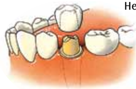
Kroon, een kapje over een tand of kies

Het kapje zit op de tand of kies vastgelijmd. Door een kroon krijgt de tand of kies zijn oorspronkelijke vorm en functie weer terug.