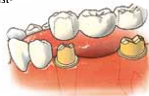
Brug: twee kronen, die op de pijlers passen en een brugtussendeel

Een brug wordt gemaakt ter vervanging van één of meer ontbrekende tanden en/of kiezen. Een brug zit vast aan twee of meer pijlers. Dat zijn afgeslepen tanden of kiezen aan weerszijden van de open ruimte van de ontbrekende tand of kies. Een brug bestaat uit twee of meer kronen die op pijlers passen en een brugtussendeel, ook wel 'dummy' genoemd. Deze bestaat uit één of meer kunsttanden en/of kiezen die op de plaats van de open ruimte komen.