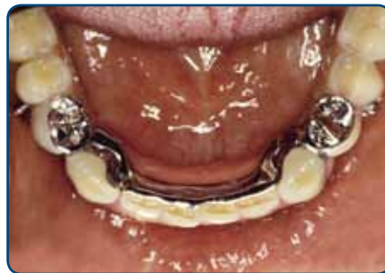
Frameprothese met verankering op kronen