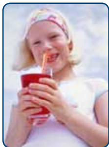
Er worden vaker en meer fris- en sportdranken gedronken

Alle kinderen zijn er gek op: snoep en frisdrank. Alle ouders weten wel dat je van snoepen gaatjes krijgt. Er zit namelijk veel suiker in. Veel minder ouders weten dat in veel zoete producten ook zuren zijn verwerkt. Je proeft ze niet, want de zoete smaak overheerst. Maar die toegevoegde zuren in voeding en dranken veroorzaken wel een ander probleem voor het kindergebit: tanderosie. Het tandglazuur van de nieuwe blijvende tanden van uw kind is nog niet volledig uitgehard. Daarom is het kindergebit extra kwetsbaar voor zuren.