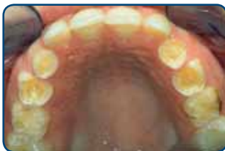
Tanderosie bij een kind van 8 jaar

Tanderosie ziet u pas in een vergevorderd stadium. Als het uiterlijk van de tanden of kiezen verandert. Te laat dus. Gelukkig kan de tandarts of mondhygiënist het eerder ontdekken. Door tanderosie kunnen de voortanden korter en dunner worden (dus kwetsbaarder voor breuk) of ze krijgen doorschijnende en rafelige randen. Verder kunnen de tanden plaatselijk steeds geler worden of donkere plekken krijgen. Het glazuur wordt namelijk dunner en het onderliggende gele tandbeen schijnt er dan doorheen. In de knobbels van de kiezen kunnen putjes ontstaan. In een later stadium kunnen de knobbels van de kiezen zelfs helemaal verdwijnen. Dan kauwt uw kind dus op het tandbeen. Dat geeft pijnklachten en gevoeligheid.